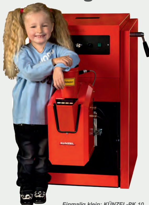
Einmalig klein: KÜNZEL-PK 10